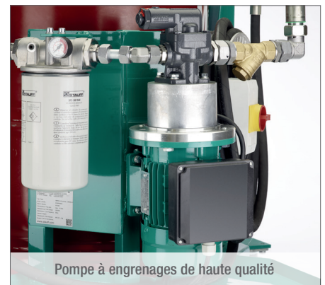
Pompe à engrenages de haute qualité