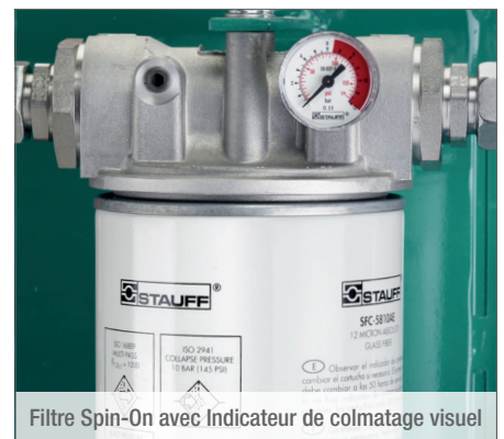
Filtre Spin-On avec Indicateur de colmatage visuel