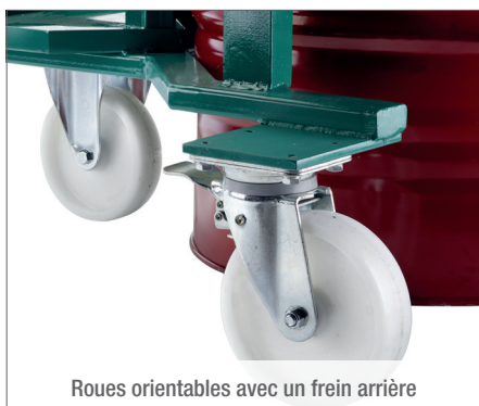
Roues orientables avec un frein arrière